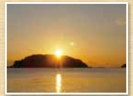
当館屋上よりの日の出

宮城県気仙沼市大島長崎 176 Tel.0226-28-3500 (代) Fax.0226-28-3231 HP http://www.akemiso.com