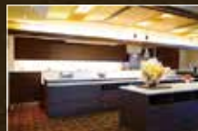
▲ダイニングキッチン