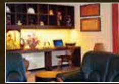
▲インターネットスペース